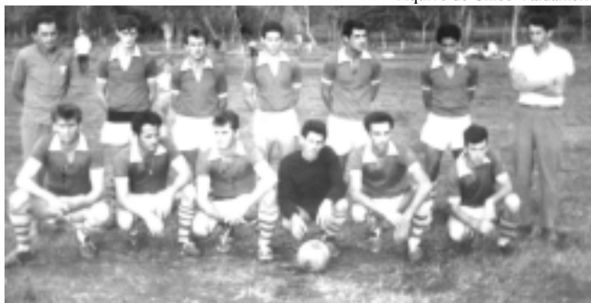
Atlético Futebol Clube de Renascença - 1972.