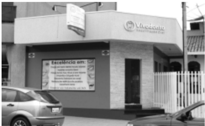
Vivodonto, na Rua Wenceslau Brás, Centro.