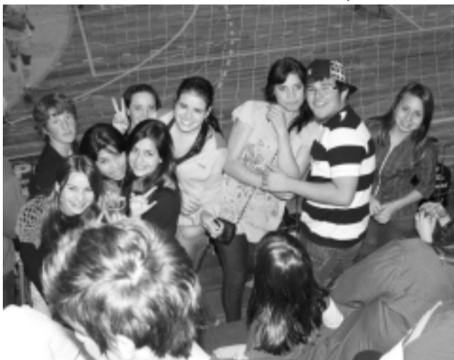
Galera jovem assistiu ao jogo e torceu muito no ginásio de esporte Mário Nardi, sábado passado.