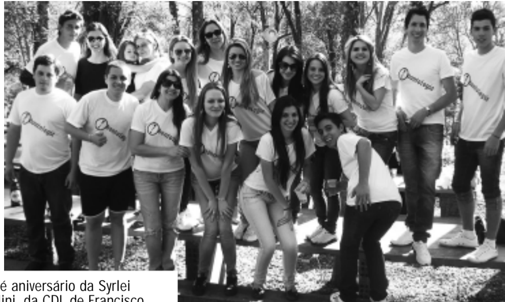
1ª festa do curso de Odontologia da Unisep, de Francisco Beltrão, realizada sábado, dia 3 deste mês.