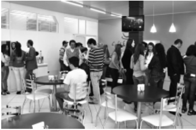
Um das novidades encontradas pelos acadêmicos foi a nova cantina, com a máquina de café.