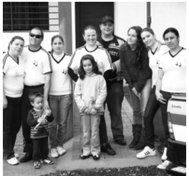
O Grupo de Jornada Jovem de Pato Branco, Unidos em Cristo, realizou uma campanha do agasalho e arrecadaram mais de 1.400 peças de roupas.