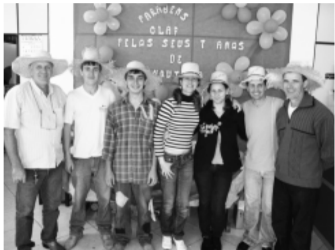
A Cooperativa de Leite da Agricultura Familiar (Claf), de Salto do Lontra, comemorou sexta-feira, 24, seu 7º aniversário. Para marcar a data a cooperativa realizou algumas promoções além de sorteio de brindes e prêmios. Durante o dia também foi servido coquetel aos participantes. Funcionários e diretores estavam trajados com roupas caipiras.