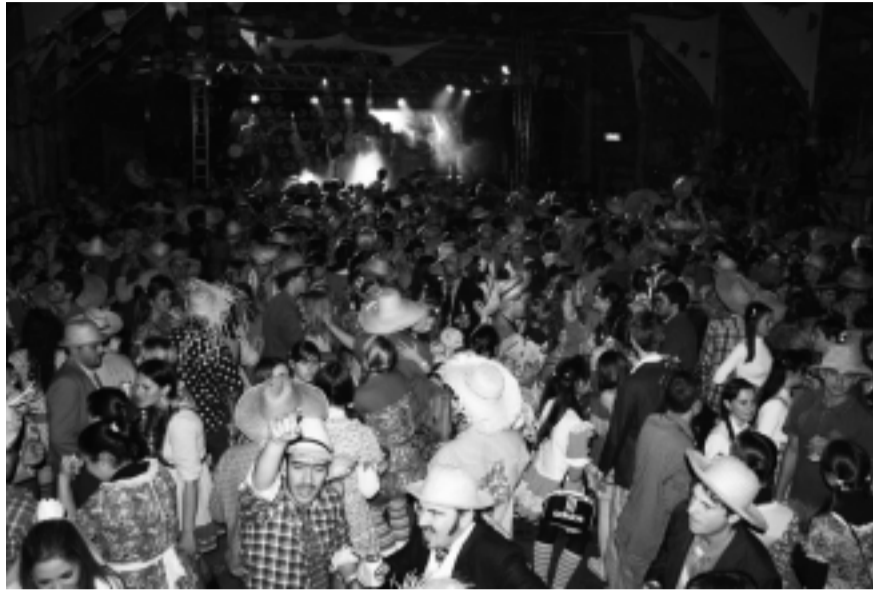
No palco principal do Rancho Dariva, como foi nos anos anteriores, o público vai se divertir até à meia-noite e meia ao som da banda Sabor do Som.

E cada ano se reúnem mais turmas, como se fosse um bloco, compram tecidos e fazem roupas iguais pra todos. "Vendemos ingressos para pessoas de várias cidades. Inclusive de Dois Vizinhos e Pato Branco, estão nos cobrando para colocarmos pontos de vendas lá nos próximos anos. Cada um que liga de longe, pede 20, 30, até 40 ingressos para trazer a turma toda. Os camarotes foram vendidos em menos de meio-dia, antes de abrimos a venda das entradas. Inclusive um dos camarotes foi uma turma de Foz do Iguaçu que adquiriu.", frisa Dariva. Além de Foz, também foram vendidos ingressos pra toda região Sudoeste, Cascavel, Curitiba, Chapecó (SC) e várias outras cidades do Paraná e do