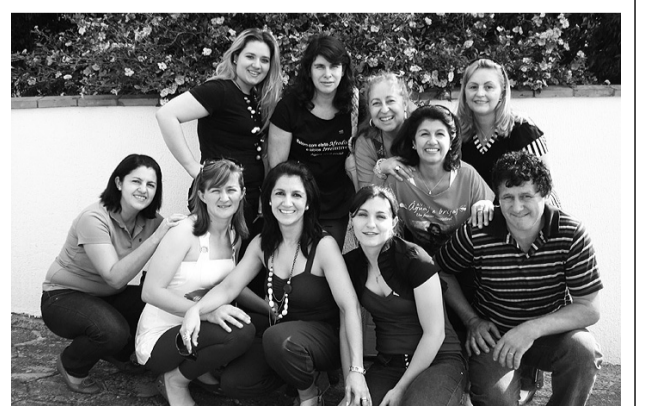
A equipe Avon convida suas revendedoras, para o maior evento do ano com show room dos estoques presenteáveis de Natal e muitas outras atrações que acontecerá segunda-feira, dia 31, no salão Pedro Granzotto, em Francisco Beltrão, das 10 às 17 horas. Você revendedora Avon é nossa convidada especial.