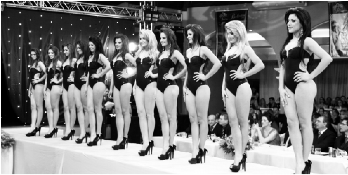
As 14 candidatas ao Miss Teenager e Miss Beltrão na entrada de maiô.