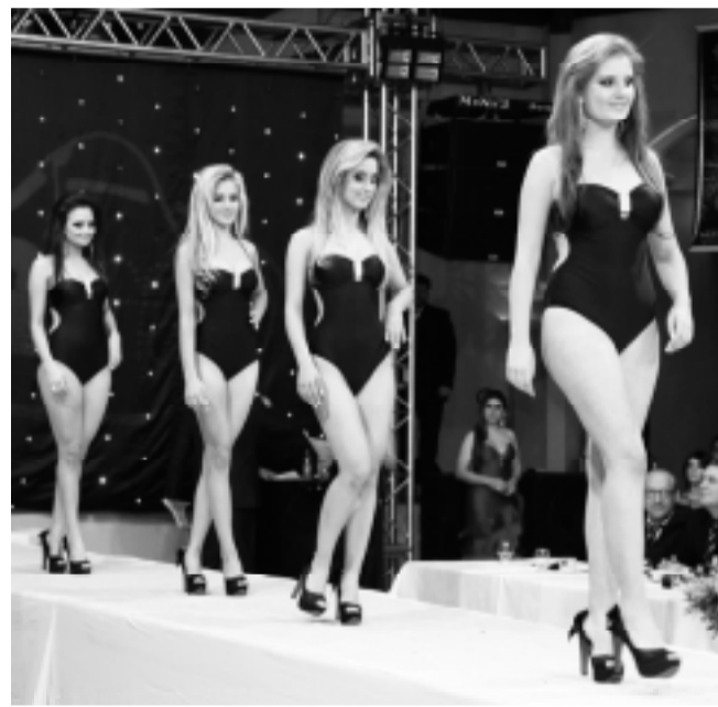
Candidatas ao Miss Teenager desfilam de maiô.