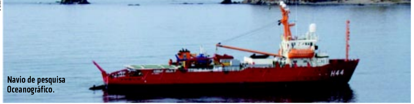
Navio de pesquisa Oceanográfico.