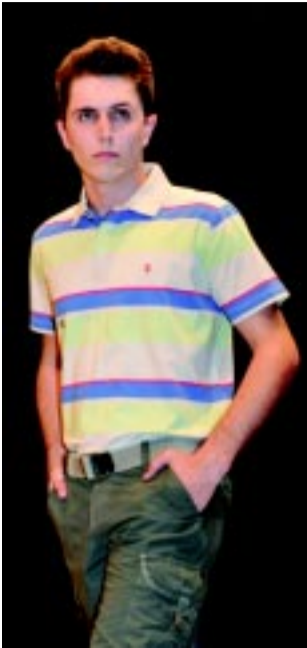
Traymon, de Santo Antônio, com ênfase nas polos.