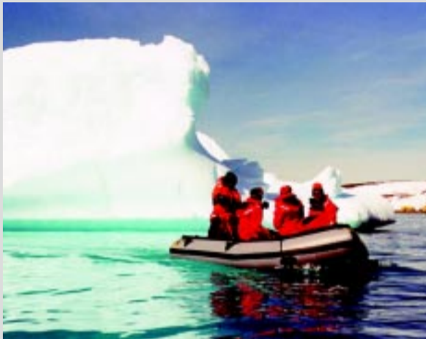
Saída de campo para coletar peixes em bote inflável.