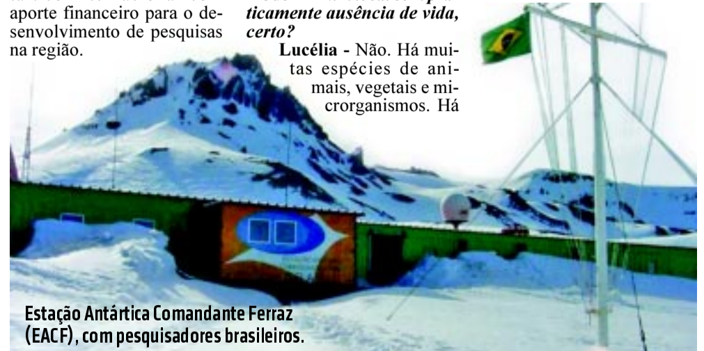
Estação Antártica Comandante Ferraz (EACF), com pesquisadores brasileiros.