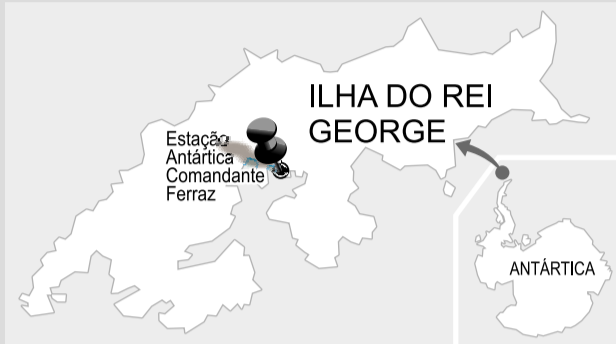
Ilha do Rei George e sua localização em relação ao Continente Antártico.