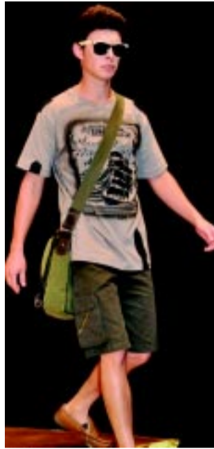
Ângelo Ferrari para momentos casuais.