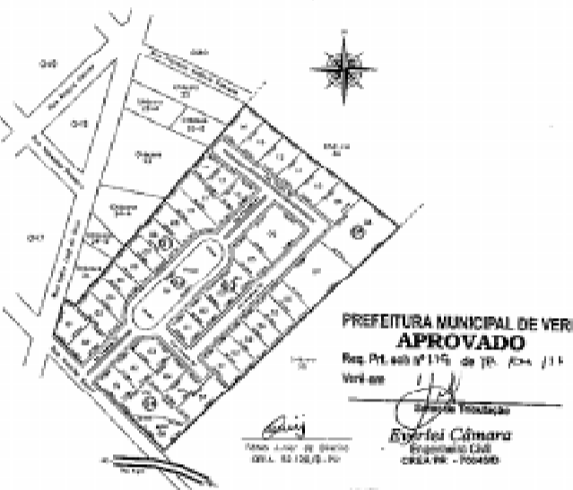
Loteamento Residencial São Francisco