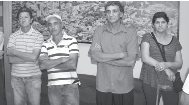
Lideranças do bairro São Miguel no gabinete.