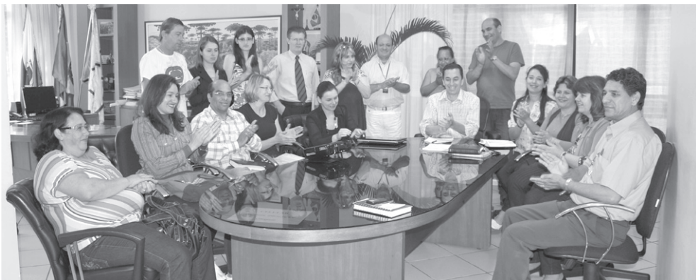
Na hora da foto, o pessoal aplaudiu, comemorando a reunião no gabinete.

A reunião teve como objetivo a finalização do Projeto de Lei do Plano de Cargos e Salários do quadro de funcionários da administração municipal e a revisão do Estatuto dos Servidores Públicos