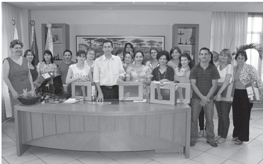
Professores recebem notebooks no gabinete do prefeito ontem à tarde.