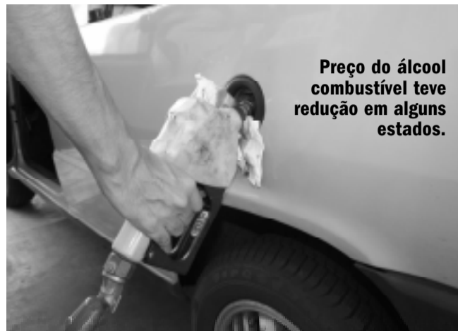
Preço do álcool combustível teve redução em alguns estados.

(AE) - Os preços do etanol hidratado praticados nos postos brasileiros recuaram em 14 Estados e no Distrito Federal, de acordo com dados coletados pela Agência Nacional de Petróleo Gás Natural e Biocombustíveis (ANP) na semana terminada em 5 de agosto de 2011. Os preços subiram em 11 Estados na semana e permaneceram estáveis no Amapá. No período de um mês, os preços do etanol recuaram em apenas 6 Estados e registram alta em 20 estados e no Distrito Federal. Em São Paulo, maior estado consumidor, as cotações caíram 0,11% na semana. No período de um mês, as cotações do etanol ficaram estáveis nos postos paulistas. A maior alta semanal foi verificada em Sergipe, de 1,58%. A maior queda se-