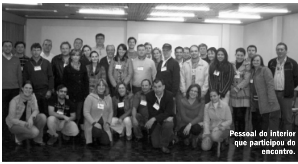
Pessoal do interior que participou do encontro.

Da assessoria e do JdeB A Secretaria de Indústria, Comércio e Turismo iniciou um arrojado programa de Desenvolvimento Local, com vistas a melhorar o perfil de todas as micros e pequenas empresas de Francisco Beltrão, incluindo o Microempreendedor Individual - (MEI). A iniciativa, que tem o apoio do prefeito Wilmar Reichembach (PSDB) abrangerá todas as demais secretarias municipais, com implicações e demandas na diversidade econômica do município.