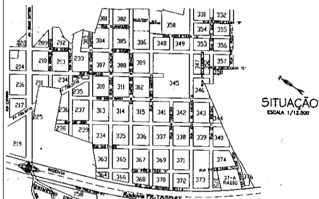
SITUAÇÃO ESCALA 1/12.500