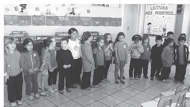
As crianças da pré-escola cantaram a música "Seu Noé".