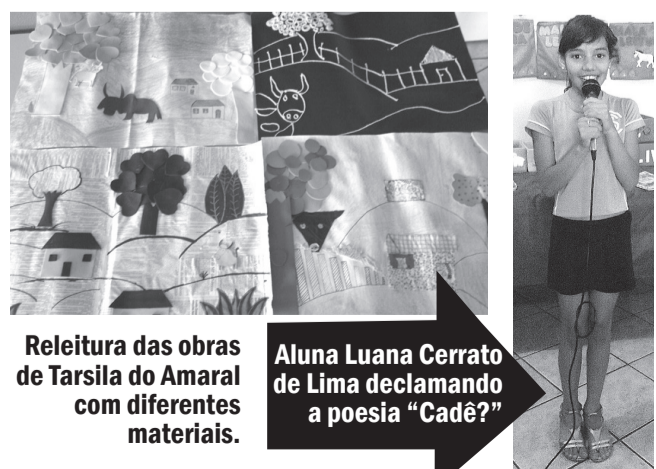
Releitura das obras de Tarsila do Amaral com diferentes materiais.