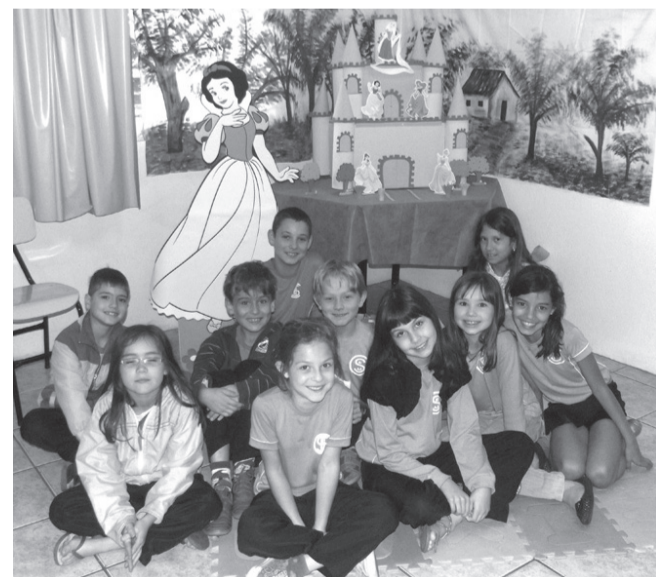
Alunos na concentração para declamar suas poesias.

Ainda na Semana da Leitura, na quinta-feira foi realizado um Sarau de Poesias em que todas as séries declamaram poesias.